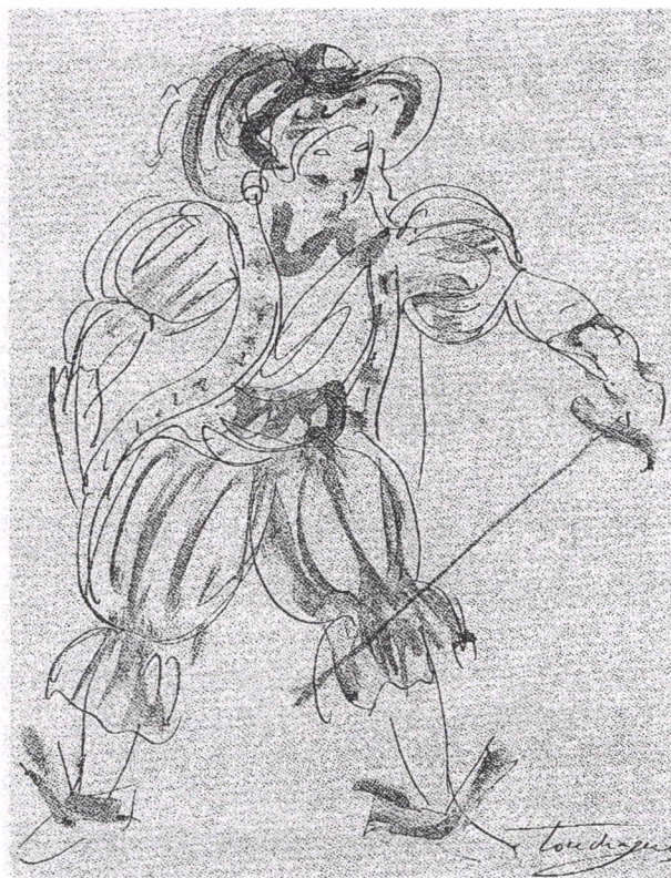
Mascarille Commedia dell'arte 1940 plume et lavis 24.5x19