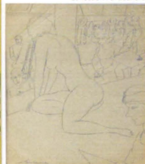
L'atelier de dessin Collection Particulière

Touchagues en Amiral maître-nageur au BAI UBU à Montparnasse (1930)