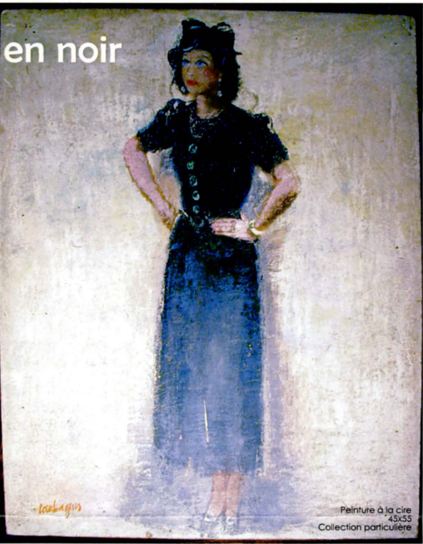
Peinture à la cire 45x55 Collection particulière